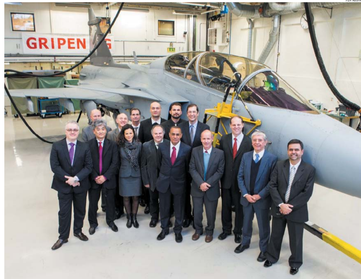
Missão do APL da Defesa do ABC em visita à fábrica da Saab na Suécia

“Estamos colocando a região na rota da FAB, ampliando as possibilidades e com a estimativa de criação